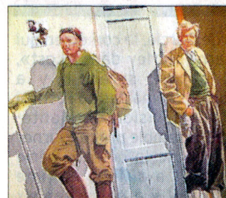
Des figures de l'alpinisme qui seront "installées" en Haute-Savoie à partir du 19 juillet.

Se connecter sur le site www.a-fresco.com